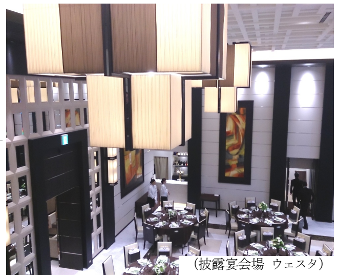
(披露宴会場 ウェスタ)

力できた事に幸せを感じます。高い天井に施されたシャンデリアやアーティスティックなライトは、かなりの重量物で施工には苦労しましたが、完成した後を見ますと毎回のように、そんな苦労はどこかへ飛んで行ってしまいます。「ザ・ファイブシーズン」とは、5つめの季節。ふたりがともに歩まれた四季の軌跡(春夏秋冬の思い出)から未来へ続く「始まりの季節」の意味のように囲